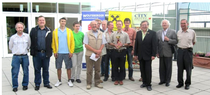
Gruppenfoto „Alle Sieger“