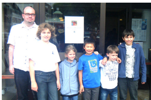
U8 - U10