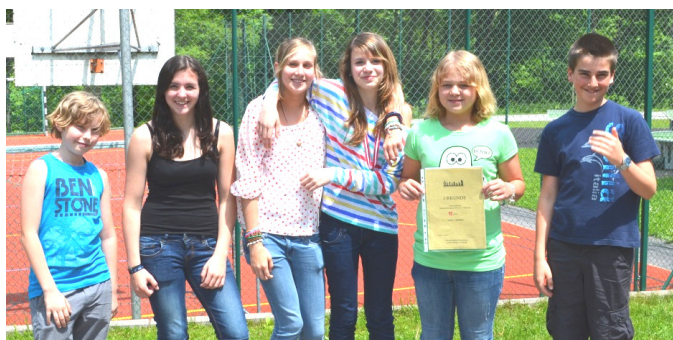
U 12 - 14