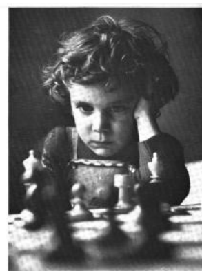
INTERNATIONALES SCHACHTURNIER 26. 5. - 2. 6. 1979 · TERNITZ

2005 gewinnt der Verein das NÖ-Cup-Finale in Litschau.