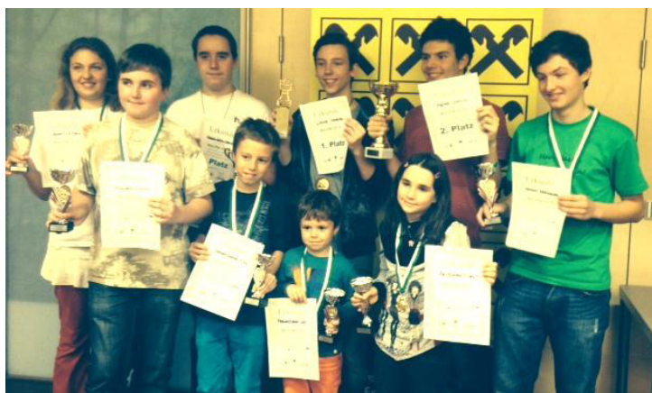
WeiJem: Alle Pokale

Bei der Siegerehrung übergab die Direktorin der Raika Eggenburg allen Spielern und Spielerinnen eine Urkunde und eine Erinnerungsmedaille. Die Veranstaltung fand im Sitzungssaal der Raika Eggenburg statt.